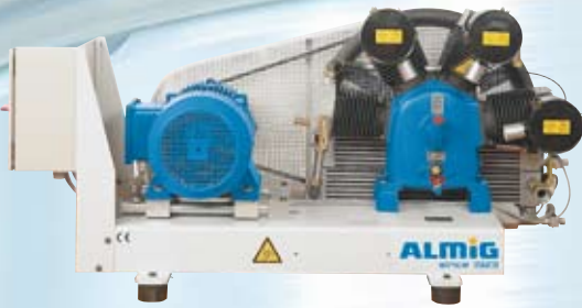
HL auf Grundplatte