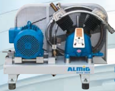
Booster auf Grundplatte