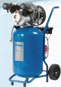
AT 6002 AT 7002