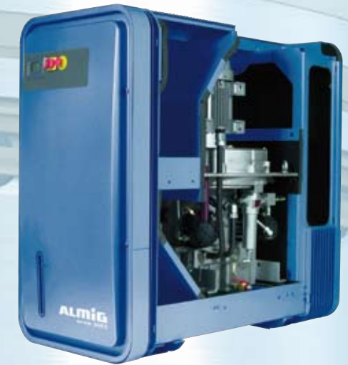
HP, im standardmäßigen Schalldämmgehäuse