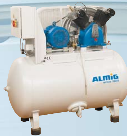
HL auf Behälter