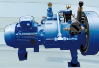
Booster auf Schwingelementen